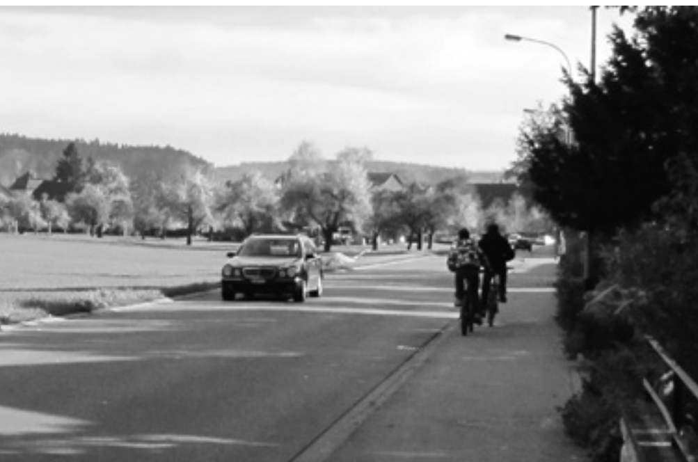
Die «schmale» Stationsstrasse mit einer nicht korrekten Nutzung des Trottoirs als Velostreifen